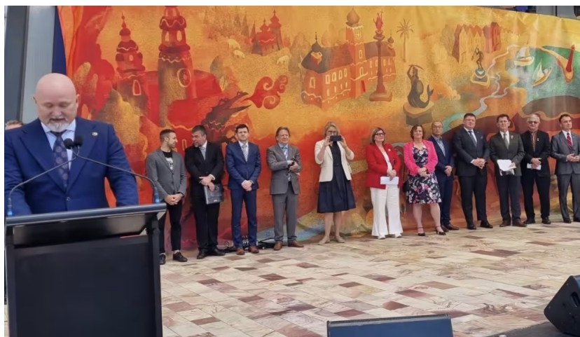
Ambasador RP w Australii, Maciej Chmieleński dokonuje przemówienia otwierającego w Polski Festiwal w Melbourne