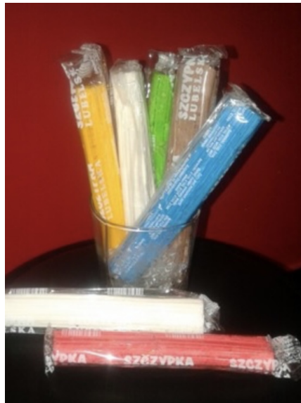
"Szczyпка lubelska" sprzedawana jest na Lubelszczyźnie.

Te dwa święta stanowią świadectwo spirytualnego przywiązania Polaków do tradycji chrześcijańskiej, w tym czci, tym, którzy odeszli, zasłużwszy się swojej Ojczyźnie.