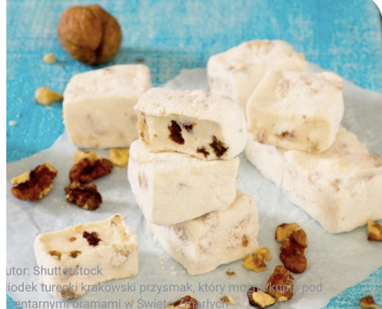
“Miodek turecki” is a candy traditionally sold in Kraków during All Saints Day.