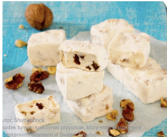
iodek turecki krakowski przysmak, który można kupić pod centarnymi bramami w Świątyni Maryjnej