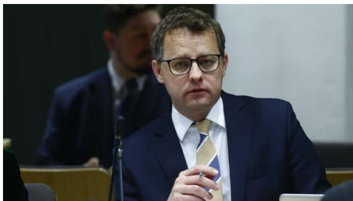
Posel Parlamentu Europejskiego Marcin Romanowski.

Waszyngtoński Institute of World Politics opublikował w marcu 2026 raport posła PiS Marcina Romanowskiego, w którym poseł przeprowadził analizę funkcjonowania polskiego wymiaru sprawiedliwości na przykładzie sprawy sędziego Dariusza Łubowskiego z Sądu Okręgowego w Warszawie.