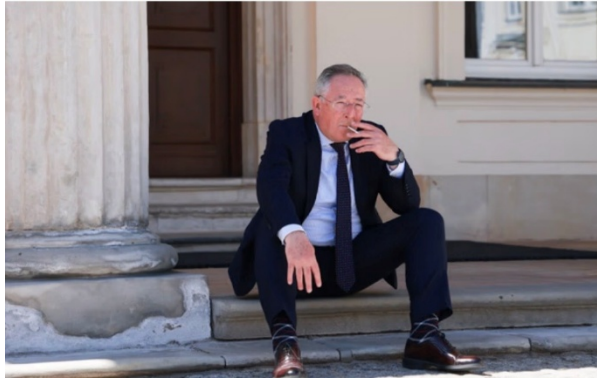
Były minister, obecnie poseł Parlamentu Europejskiego Bartłomiej Sienkiewicz.

Działania Ministra zostały podjęte z naruszeniem przepisów ustawowych. Dnia 8 kwietnia 2024 r. Telewizja Polska S.A. została formalnie „postawiona w stan likwidacji” w celu ułatwienia przejęcia ręcznej kontroli przez rząd – wbrew wyrokowi Trybunału Konstytucyjnego z 18 stycznia 2024 r., który stwierdził, że postawienie w stan likwidacji byłoby sprzeczne z prawem.