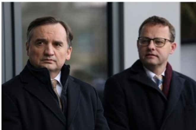
Minister Zbigniew Ziobro i poseł Parlamentu Europejskiego Marcin Romanowski.

Od początku kadencji Sejmu i Parlamentu Europejskiego (od wyborów w 2023 roku) immunitet straciło lub zrzekło się co najmniej 11 kluczowych polityków powiązanych z opozycją (głównie z Prawa i Sprawiedliwości oraz Suwerennej Polski).