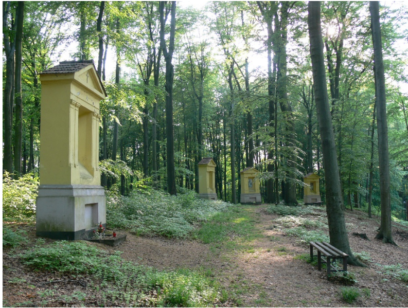
Droga krzyżowa w Lesie Bukowym