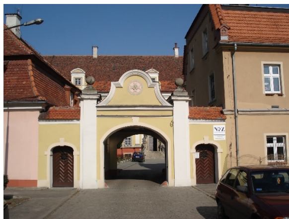
Klasztor Sióstr Borymeuszek

Nas, zagnanych tam potrzebą rodzinną, wzruszyła również sceneria Lasu Bukowego, na którego terenie, którego znajduje się plenerowa kalwaria. Wysokie na około 3,5 m, kaplice przedstawiają obrazy malowane na blasze, a które to zostały wzniesione najprawdopodobniej już w XV wieku.