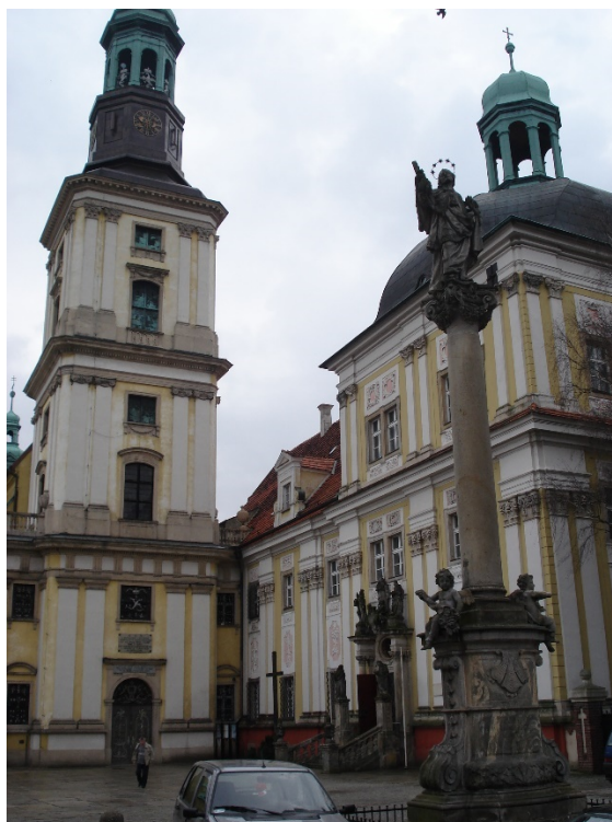
Sanktuarium św. Jadwigi w Trzebnicy

Ofiarnie opiekowała się klasztorem cysterek, ufundowanym przez Henryka w 1203 roku w Trzebnicy. Poddawała się surowej ascezie, coraz więcej czasu spędzała na modlitwach. Jadwiga nigdy jednak nie złożyła ślubów zakonnych – jednym z powodów była chęć swobodnego zarządzania okazałym majątkiem.