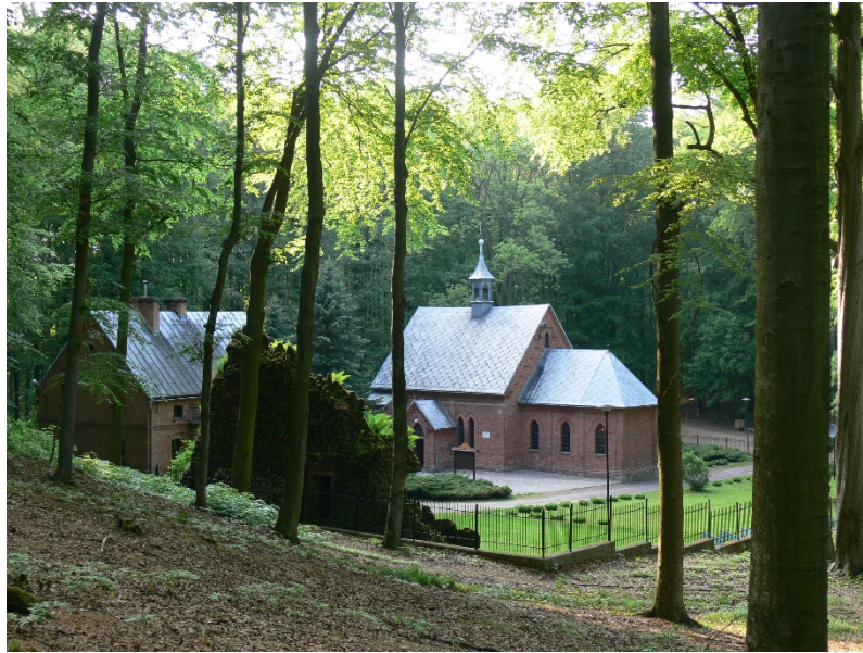
Kościół Czternastu Świętych Wspomożycieli