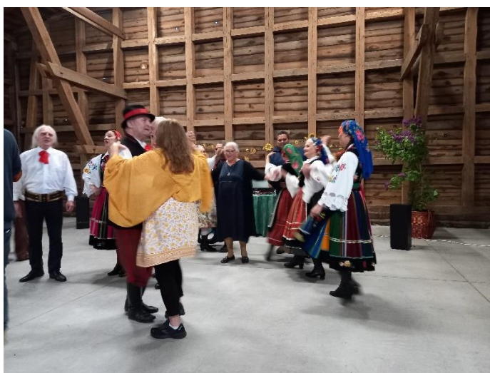
Głuszyna - wspólne tańce. Strzelecki i Kościuszko łączą zarówno Monero-Ngarigo jak i Polaków z Górą Kościuszki.