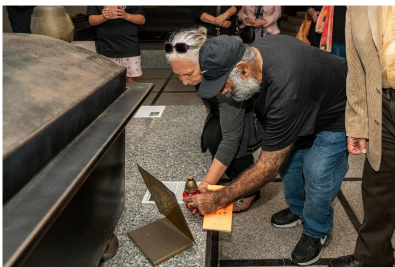
W Krypcie Zasłużonych Wielkopolan - znicze w hołdzie P.E. Strzeleckiemu.