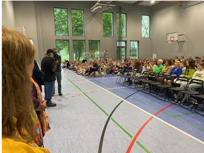
Głuszyna, rodzinna miejscowość Strzeleckiego. Aula w Szkole im. Strzeleckiego - ciepła i pojemna jak serce kochającej matki. Tego się nigdy nie da zapomnieć!