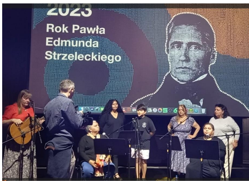
Poznański PAWILON. Bardzo nam przypadła do gustu scenografia z nader ciekawym elementem graficznym.