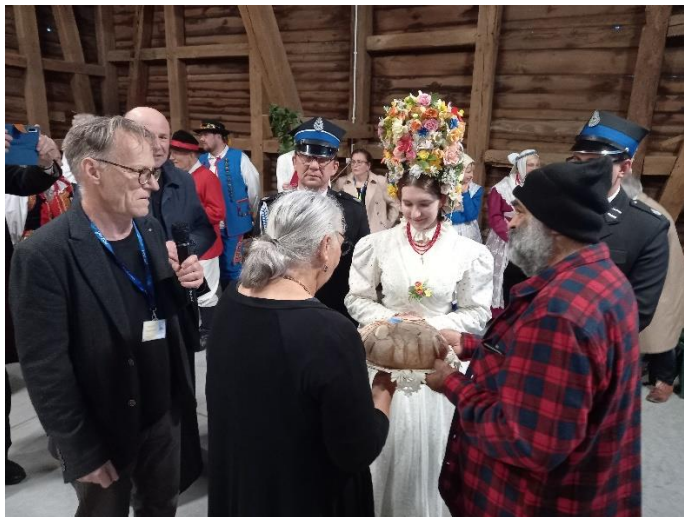
Głuszyna, powitanie delegacji Tradycyjnych Kustoszy z polską serdecznością: chlebem i solą.