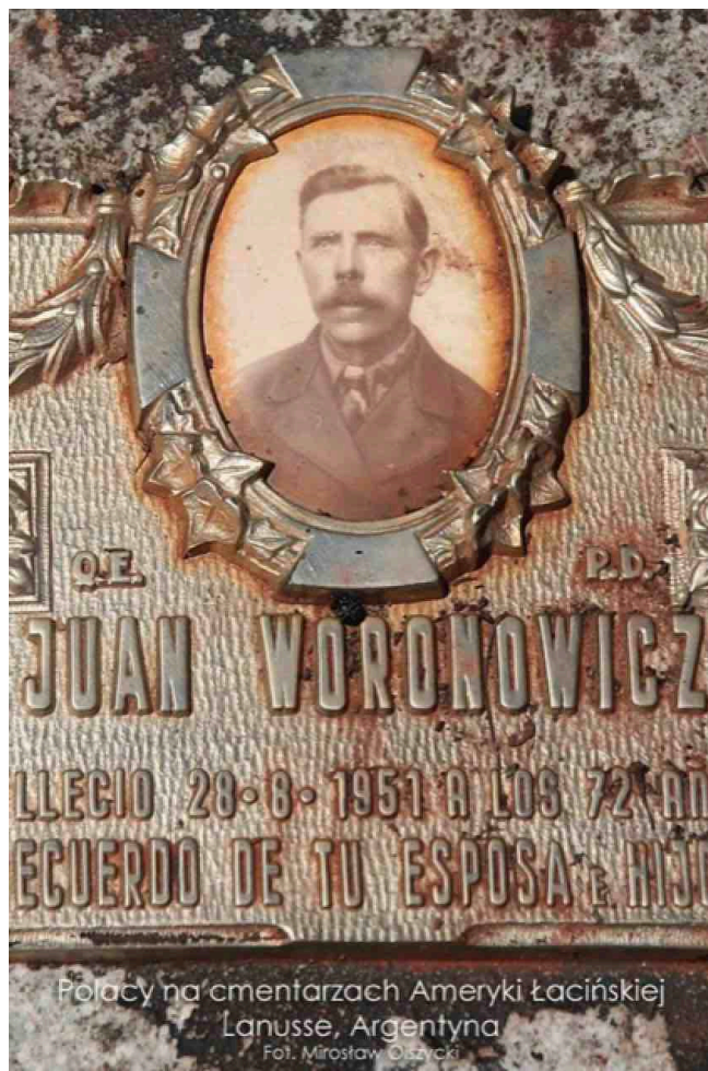
Polacy na cmentarzach Ameryki Łacińskiej Lanusse, Argentyna