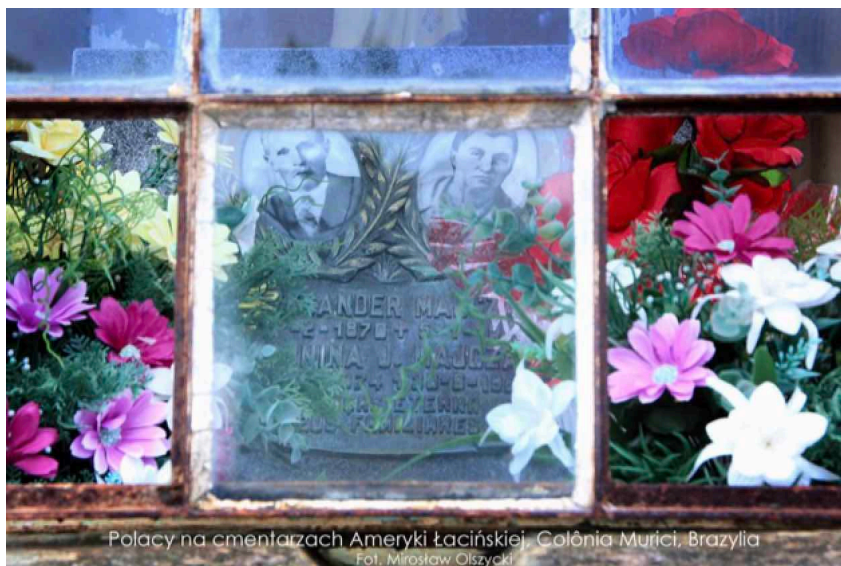
Polacy na cmentarzach Ameryki Łacińskiej, Colônia Murici, Brazylia