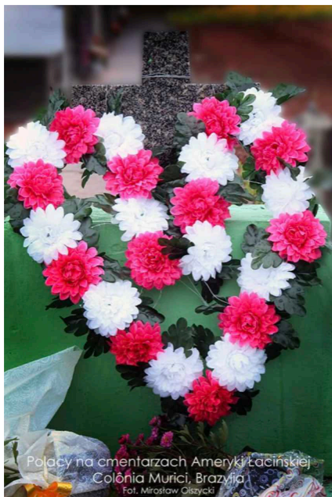
Polacy na cmentarzach Ameryki Łacińskiej Colônia Murici, Brazylia