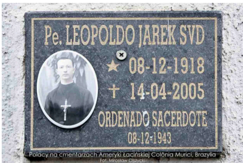
Polacy na cmentarzach Ameryki Łacińskiej, Colônia Murici, Brazylia