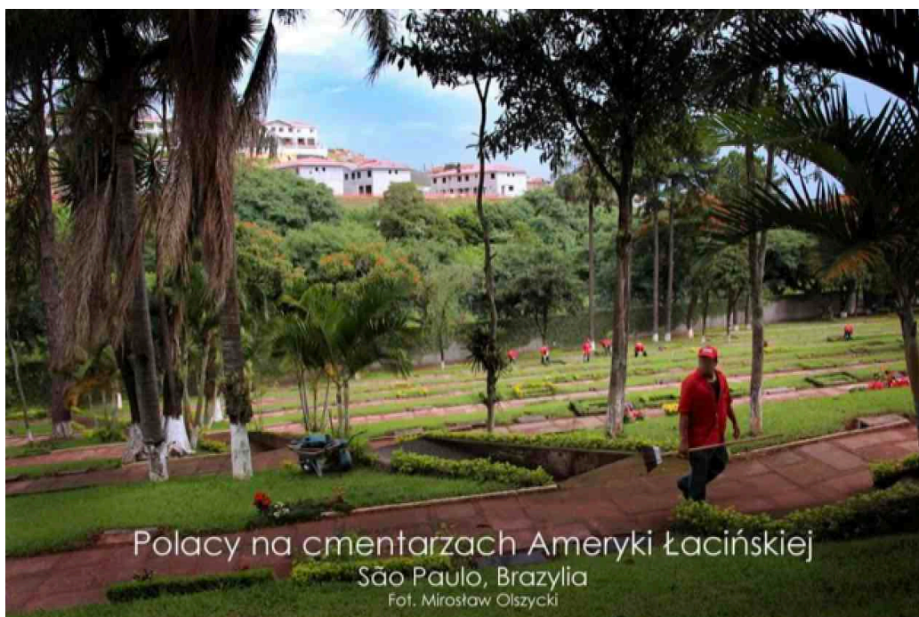
Polacy na cmentarzach Ameryki Łacińskiej São Paulo, Brazylia