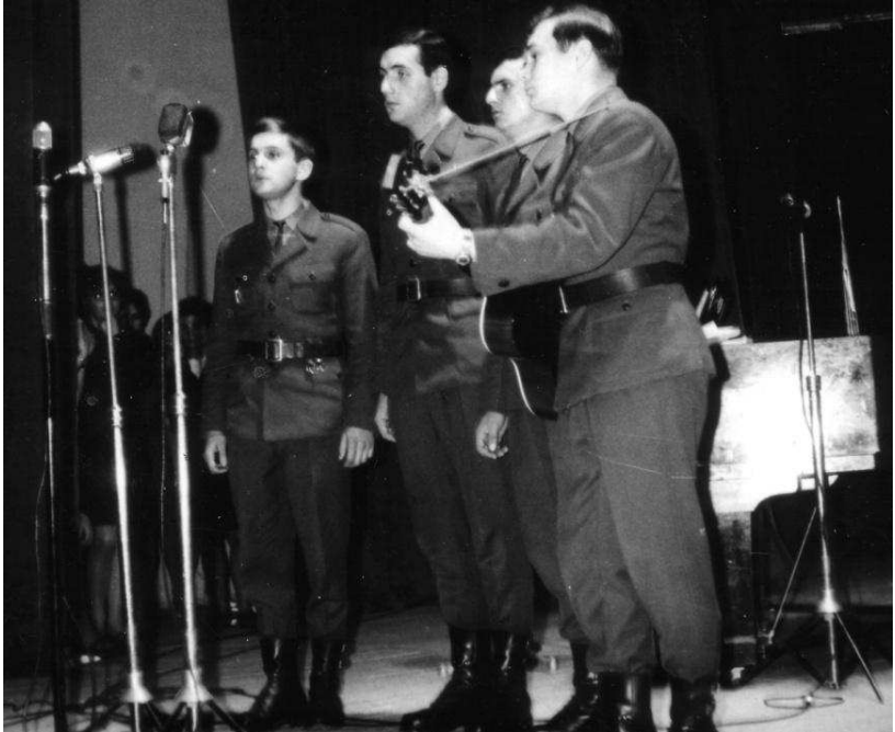
Podczas koncertu (autor wspomnień pierwszy z lewej)