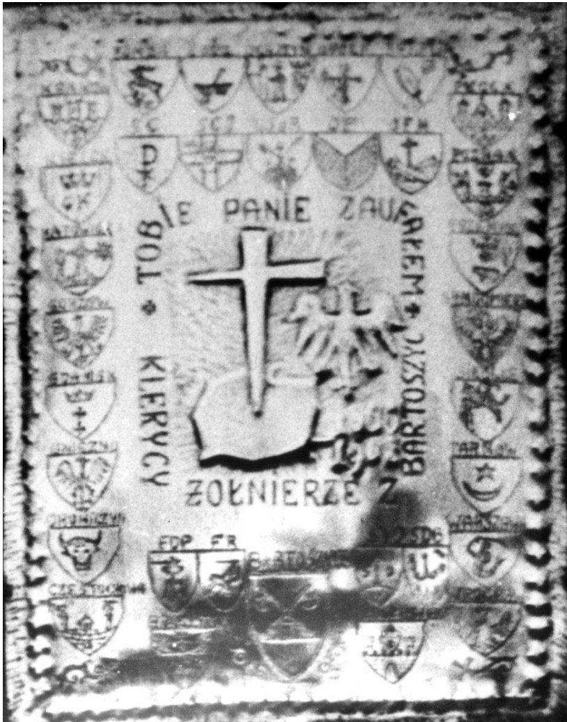
Votum dziękczynne kleryków J W 44 13 ofiarowane na Jasną Górę w 1968 roku