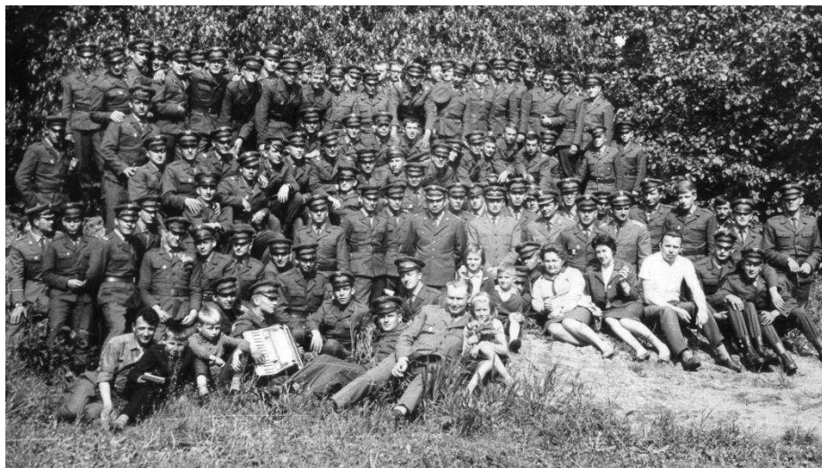
Zdjęcie zbiorowe z wycieczki do Kętrzyna

„Cywile”, bo tak nazywaliśmy kolegów nie kleryków, znajdowali się w każdej drużynie. Dość długo trwała identyfikacja - kto jest kim: kleryk czy „cywil”, z którego seminarium i skąd. Po oddaniu odzieży cywilnej, ubrani w mundury wojskowe, zostaliśmy przydzieleni do odpowiednich kompanii, plutonów i drużyn. W bloku parter zajęła kompania I, pierwsze piętro kompania II, a drugie piętro kompania III.