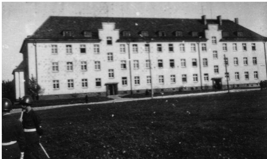
Budynek jednostki kleryckiej J. W. 44 13

Gdy przyszła na nas kolej, patrol złapał nas i zaprowadził do wojskowej hali sportowej znajdującej się na terenie jednostki. To był cel ostateczny naszej podróży. Ostrzygli nas tak strasznie krótko i byle jak, że na początku nie mogliśmy siebie rozpoznać. Potem zaszczerpiono nas przeciw ospie i odesłano na „miejsce zakwaterowania”. Był to osobny, ostatni w szeregu blok, na ogrodzonym terenie całej jednostki wojskowej. Znajdował się tam jeszcze pułk czołgów, stanowiący osobną jednostkę. Za ogrodzeniem mieściła się jednostka artylerzystów. Bartoszyce więc były dużym garnizonem. W dwupiętrowym bloku przygotowano pomieszczenia dla trzech kompanii kleryckich (1 batalion), czyli ponad 300 osób.